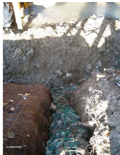
Imagen de geomalla C350 instalada, y detalle del refuerzo con gavión flexible tipo Rock roll del inicio del tramo con la geomalla.