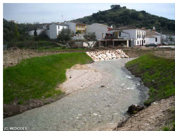
Imagen del río Anzur antes de llegar al núcleo de Aldea del Nacimiento. Fotos tomadas antes y después de la actuación.