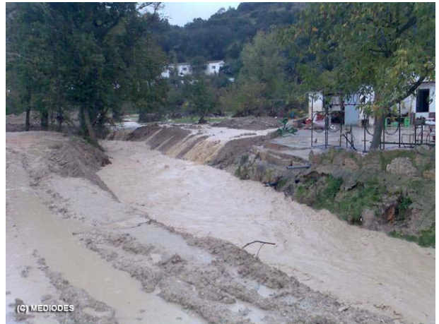
Imagen de escorrentía y avenida en una tormenta, antes de la actuación.