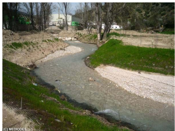
Detalles de dos tramos diferentes del río. Fotos tomadas antes y después de la actuación.